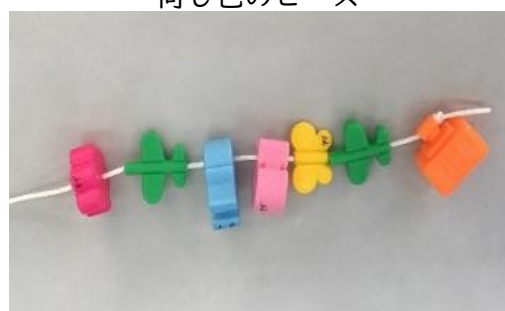
いろいろな色のビーズ