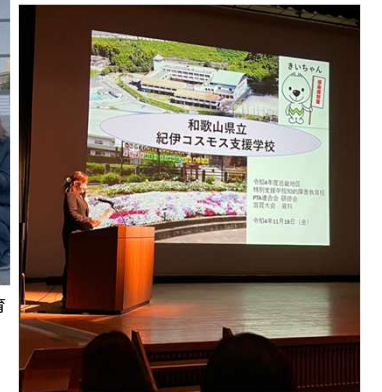
令和4年度近畿地区特別支援学校知的障害教育校PTA連合会研修会で本校の取組を発表している様子