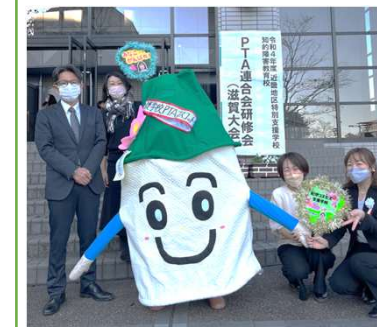
令和4年度近畿地区特別支援学校知的障害教育校PTA連合会研修会に参加

会議以外には、高等部のワークショップへの参加や物品交渉など、会長を中心として、子どもたちのためにサポートをしています。また、県盲ろう支援学校PTA連合会や近畿地区のPTAの研修会等にも参加しています。